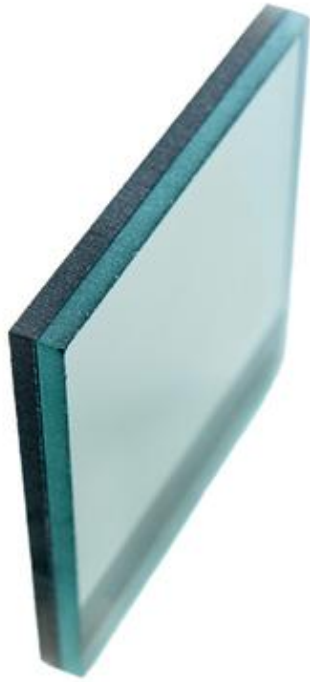
奈米陶瓷隔熱膠合玻璃