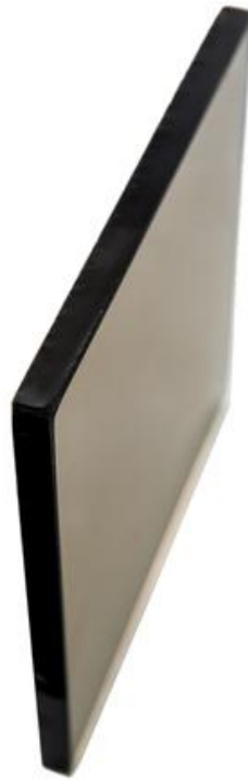
單層玻璃-茶玻 標準厚度 10-12mm