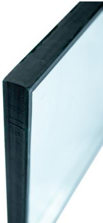
複層玻璃 最大厚度 35mm