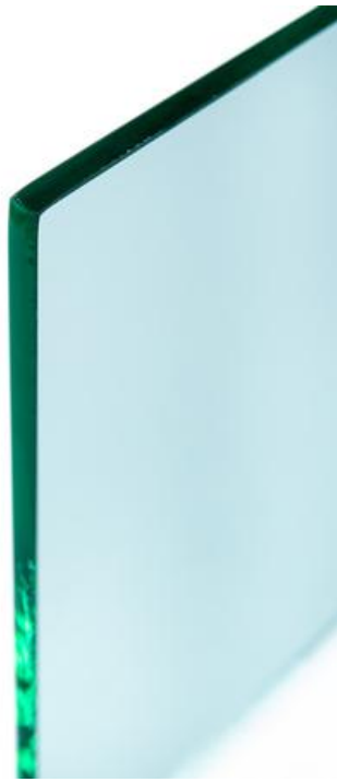
單層玻璃 標準厚度 10-12mm