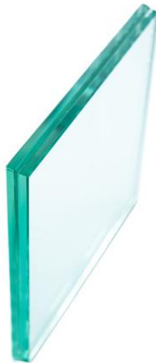
膠合玻璃 厚度 6+6mm / 8+8mm